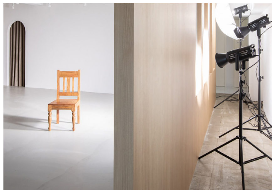
窓裏照明：夜間や早朝でも昼間のシーンが再現可能